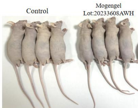
图 1-1 裸鼠荷瘤情况 Day15