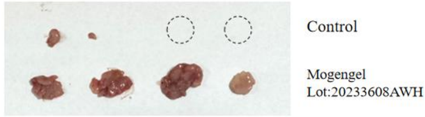
图 1-2 Day15 肿瘤体积测量