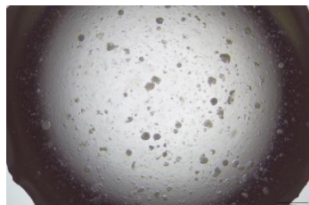
图片 1 类器官消化 7 分钟镜检图片